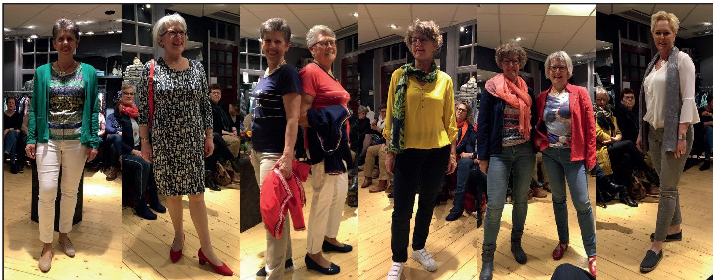
De modellen showen de nieuwste mode | bloemarrangement door Bloemisterij Slagter