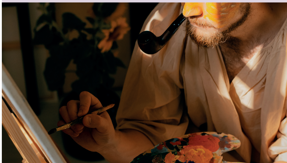
©beeld ter illustratie